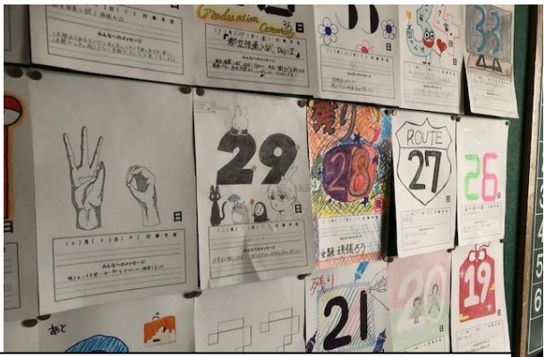
左は上級学校案内のポスター。夏前から貼ってありましたね。あと少しで役目を終えようとしています。右は3年生のカウンタダウンカレンダー。残り少なくなってきました…。