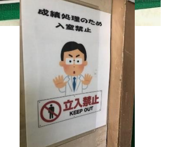
おっとこれは先生が作成。