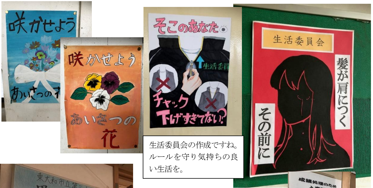
生活委員会の作成ですね。ルールを守り気持ちの良い生活を。