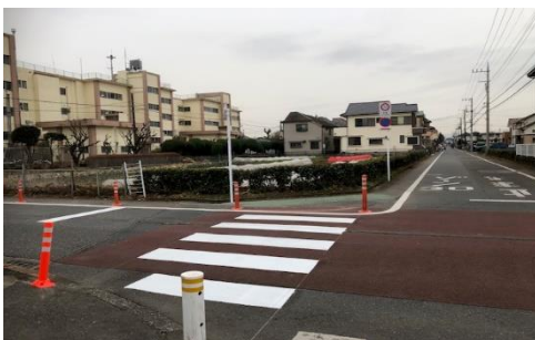
写真上:新しい横断歩道

学校の北東にある横断歩道の位置が、新しく変わりました。今までの横断歩道は削られ、テープで封鎖されています。新しい横断歩道は少し幅が狭いですが、通行には十分注意してください。第六小学校の児童が通行することもあります。危険な状況を見かけたら声をかけてあげてください。