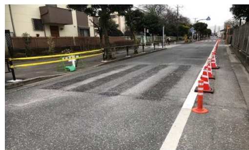
写真上:以前の横断歩道