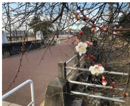
写真上:多摩湖の梅は開花! 春は近い。

日本全国の中学3年生が、義務教育の終わりを迎え、次のステージに向けて必死に頑張っています。これは長い人生の中でいくつかやってくるであろう、一つ目の大きな試練でしょう。自分が社会に対してどのように関わりながら生きていくかを問う、初めての試練ともいえるかもしれません。「将来の進路はどのように考えていますか？」面接練習での回答は、自分を理解した上での人生設計を堂々と語る生徒が多く、驚きました。将来の自分像がなんとなく見えてきて、けれど、小学校の頃に思い描いたものとは明らかに違う、現実味を帯びた将来像でした。その実現に向けて、進路先を選択し、成し遂げようとしている3年生全員に心からのエールを送ります。自信をもって進路を切り拓いてください。