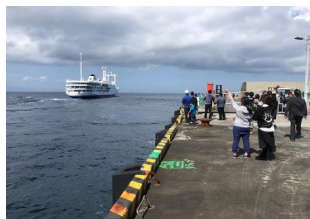
写真上:受験生を乗せて船は行く

以前、私が勤務した島の中学校でも、この時期は同じように3年生が進路選択に取り組んでいました。しかし、内地の学校とは大きく事情が違います。島に上級学校と呼べる学校はありません。ですから、進学を希望する生徒は全員島を離れることになります。それは同時に家を出るということです。つまり生徒の多くは親元を離れ、寮や親せきの家での生活が始まるのです。進路選択は、まさに新しい生活への挑戦でした。少しの期待と大きな不安の中で、受験勉強が始まり、そしてこの時期を迎えるのです。西風が大変強い1月から3月は、船が着かなかったり、ヘリが飛ばななったり、交通の状況は自然環境に大きく左右されます。ですから試験の3日も4日も前に、必死の思いで出かけ、受験に臨むのです。それを見守る我々教員も、そして島の人々も、受験生を乗せて栈橋から出る船を見送りながら、どうか合格してくれと、真剣に祈ったものでした。